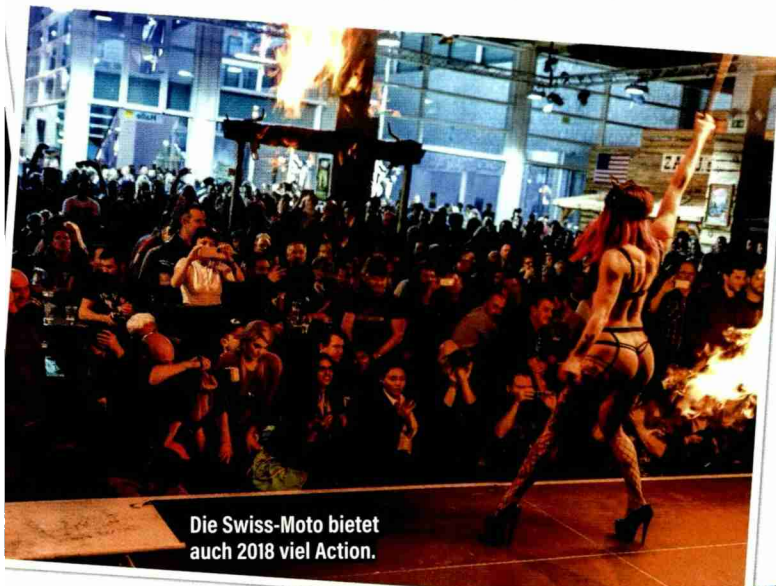
Die Swiss-Moto bietet auch 2018 viel Action.

Die Swiss-Moto 2018 punktet mit ganz viel Frauenpower.