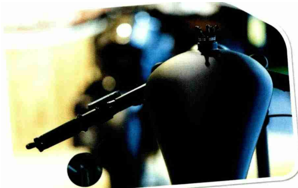
Eine Sonderausstellung widmet sich Militär-Motorrädern.